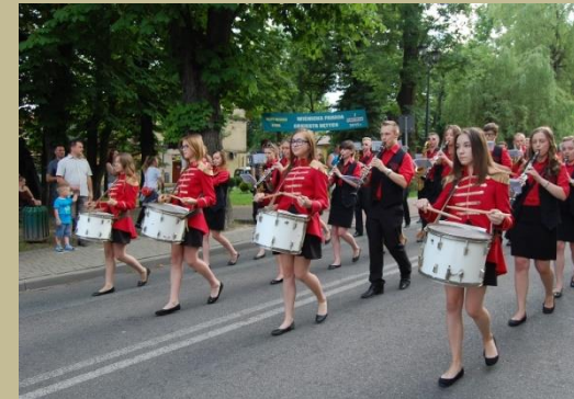
Parada Orkiestr Dętych w Nowym Wiśniczu