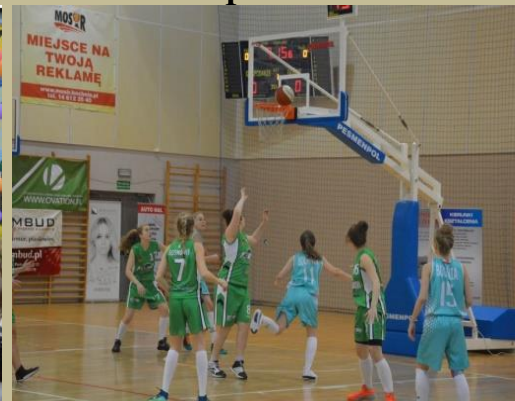
Międzynarodowy Festiwal Koszykówki w Bochni