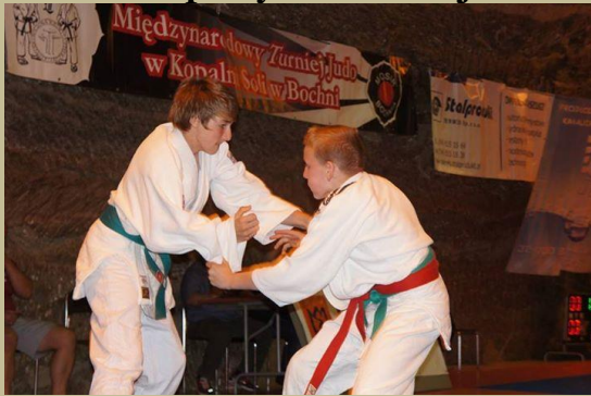
Międzynarodowy Turniej Judo w Kopalni Soli w Bochni