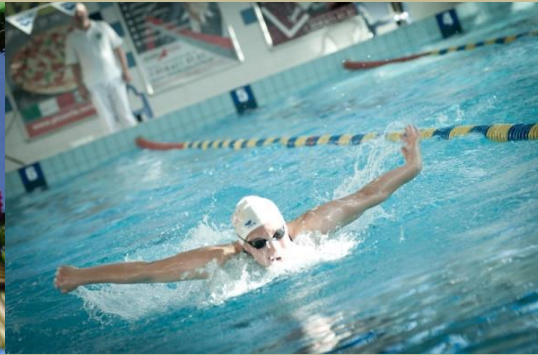
Memoriał Pływacki im. Jana Kota w Bochni