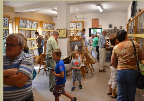
Weekend z zabytkami Powiatu Bocheńskiego