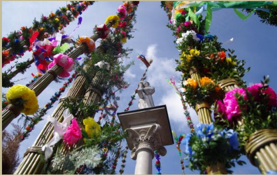
Konkurs Lipnickich Palm i Rękodzieła Artystycznego w Lipnicy Murowanej