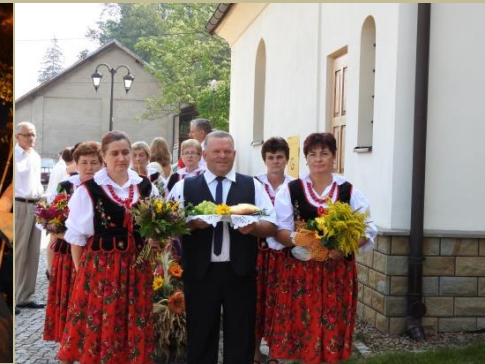
Dożynki Parafialne w Gminie Łapanów