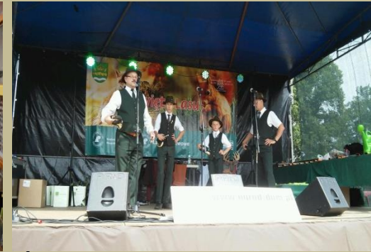
Święto Lasu w Gminie Drwinia