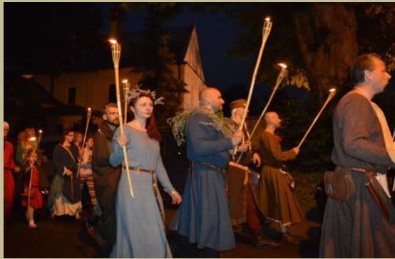
Spotkanie z Historią w Gminie Bochnia