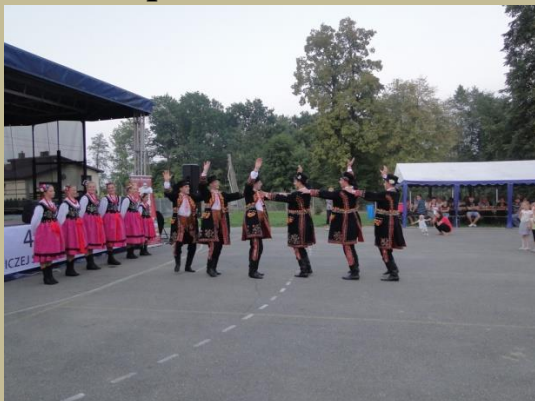
Pożegnanie lata w Gminie Rzeszawa