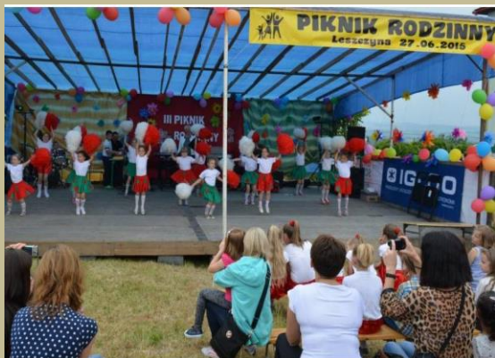
Piknik Rodzinny w Gminie Trzciana